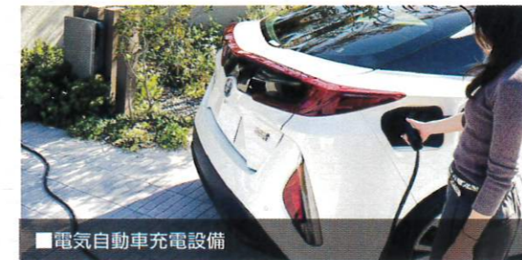
■電気自動車充電設備