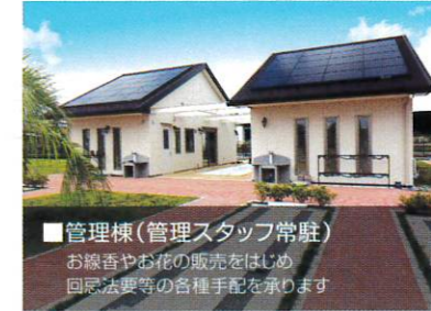
■管理棟(管理スタッフ常駐) お線香やお花の販売をはじめ 回忌法要等の各種手配を承ります