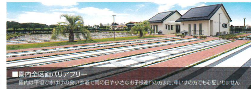
■園内全区画バリアフリー 園内は平坦で水はけの良い公道で雨の日や小さなお子様連れの方また、車いすの方でも心配りありません

【聖地霊園 未来 概要】●所在地/埼玉県朝霞市田島石川戸413 ●区域面積/9,691.90㎡ ●緑地面積/2,910.39㎡ ●墓地区画数/2,420区画 ●施設/管理棟・管理事務所・休憩所・トイレ・水場・駐車場(129台収容)・ベンチ ●事業主体/宗教法人日英寺別院 ●経営許可番号/朝環発第295号(令和4年12月21日)