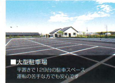
■大型駐車場 平置きで129台の駐車スペース 運転の苦手な方でも安心です